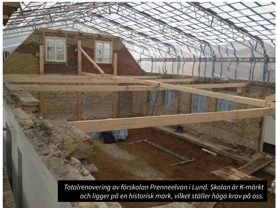
Totalrenovering av förskolan Prenneelvan i Lund. Skolan är K-märkt och ligger på en historisk mark, vilket ställer höga krav på oss.