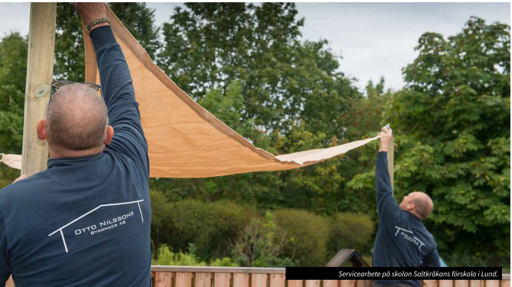
Servicearbete på skolan Saltkråkans förskola i Lund.