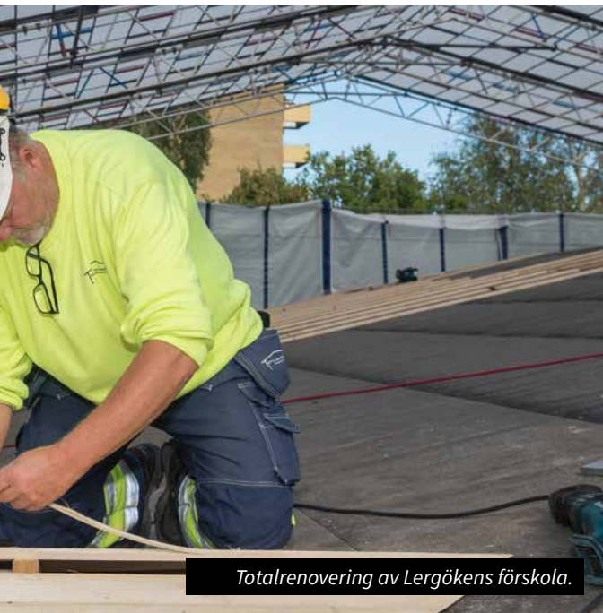
Totalrenovering av Lergökens förskola.